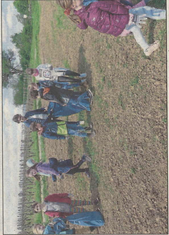
Anschließend starteten Kinder der Klasse 3b und 1d zum Aufsammeln von Müll.